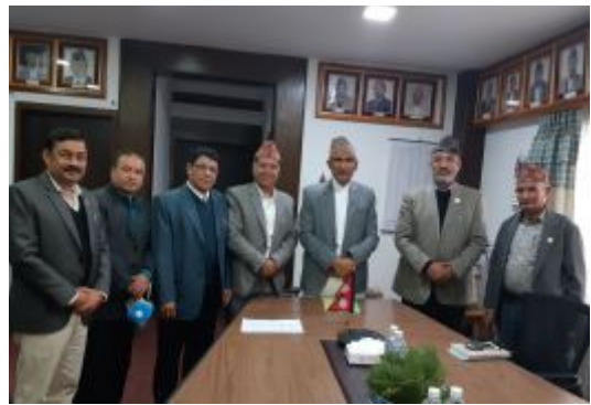
नेपाल सुनचाँदी व्यवसायी महासंघका पदाधिकारीहरूसँग सिंहदरबार स्थित उहाँकै कार्यकक्षमा भएको भेटकाक्रममा अर्थमन्त्री पौडेल ।