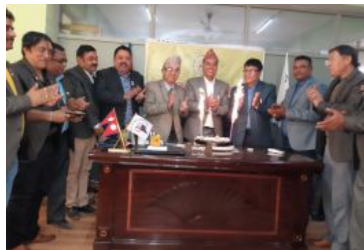
नेपाल सुनचाँदी व्यवसायी महासंघको स्थापना दिवस मनाउँदै महासंघका पदाधिकारीहरु ।