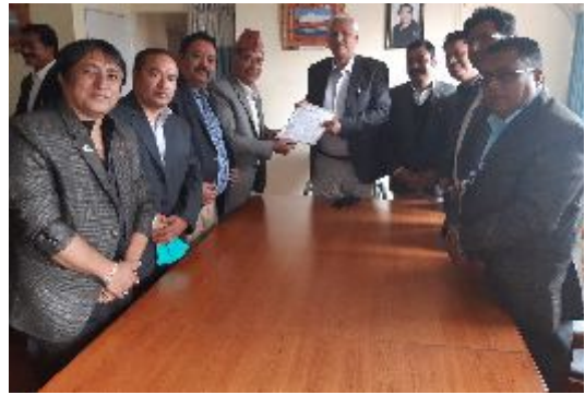
नेपाल सुनचाँदी व्यवसायी महासंघका पदाधिकारीहरूसँग उद्योग, वाणिज्य तथा आपूर्ति मन्त्रालयका तत्कालिन मन्त्री लेखराज भट्ट ।