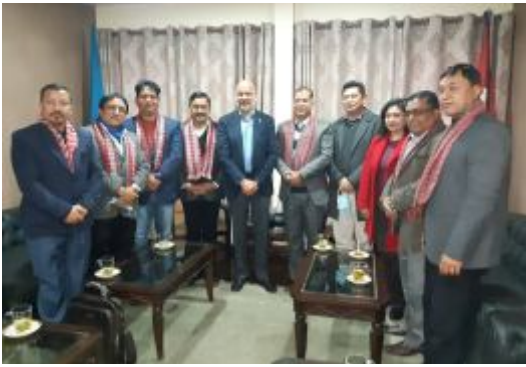
उद्योग वाणिज्य महासंघको प्रतिनिधीमण्डलसँग व्यवसायिक हितका विषयमा महासंघको छलफलमा सहभागी ।