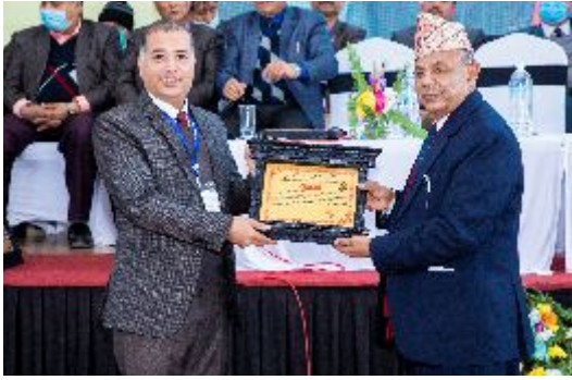
नेपाल सुनचाँदी व्यवसायी महासंघका अध्यक्षलाई कदर पत्र प्रदान गर्दै महासंघका निवर्तमान अध्यक्ष ।