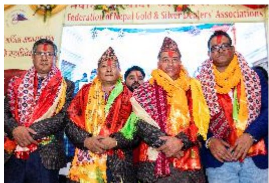
नेपाल सुनचाँदी व्यवसायी महासंघको महाअधिवेशन पछि बधाई ग्रहण गर्दै महासंघका पदाधिकारीहरू ।