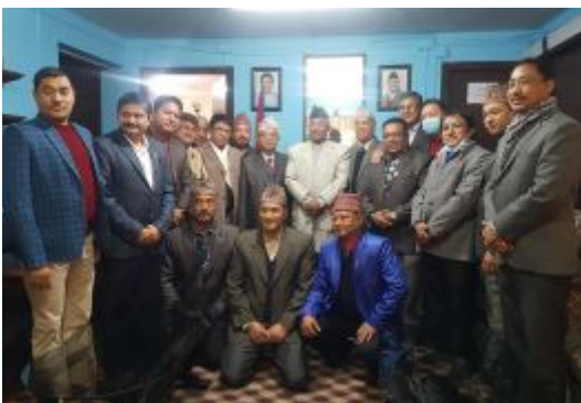
नेपाल सुनचाँदी व्यवसायी महासंघको प्रतिनिधीमण्डल शिक्षा, विज्ञान तथा प्रविधि मन्त्री एवं महासंघका सल्लाहकार कृष्ण गोपाल श्रेष्ठसगं भेटवार्ताका क्रममा ।