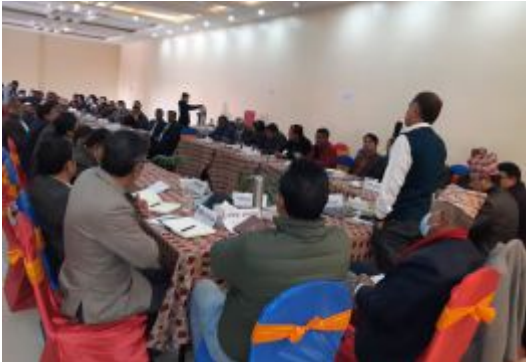
नेपाल सुनचाँदी व्यवसायी महासंघको पहिलो कार्य समिति बैठकमा सहभागीलाई सम्बोधन गर्दै महासंघका अध्यक्ष ।