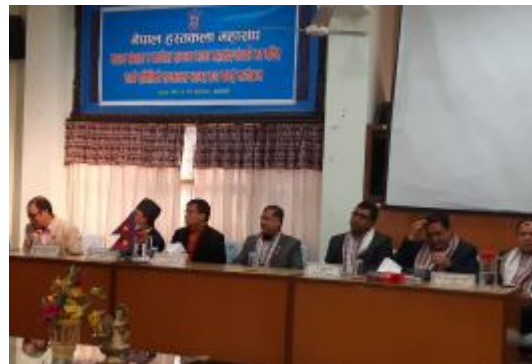
नेपाल हस्तकला महासंघले आयोजना गरेको सम्मान कार्यक्रममा सुनचाँदी व्यवसायी महासंघका पदाधिकारीहरु ।