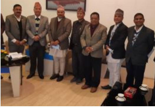
सुनचाँदी व्यवसायी महासंघका पदाधिकारी र राष्ट्र बैंकका गभर्नर महाप्रसाद अधिकारीबीच भएको भेटकाक्रममा सहभागीहरू ।