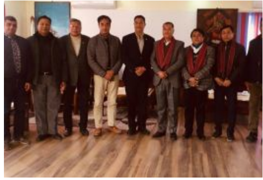
नेपाल सुनचाँदी व्यवसायी महासंघ र चेम्बर अफ कमर्शका प्रतिनिधि मण्डलबीच समसामयिक विषय वस्तुका बारेमा भएको छलफलमा सहभागी ।