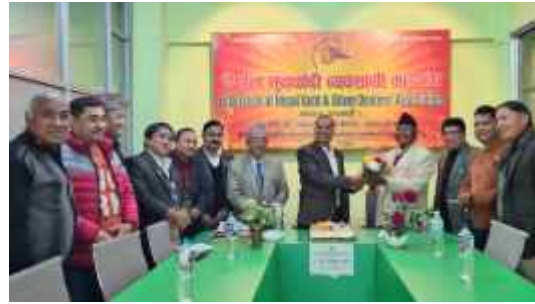
महासंघको नवौँ स्थापन दिवसमा अवसरमा आयोजित कार्यक्रममा सहभागिता जनाउँदै महासंघका पदाधिकारी तथा सदस्य एवं अतिथिगण ।