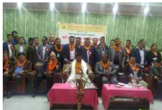
नेपाल सुनचाँदी व्यवसायी महासंघको गण्डकी प्रदेश समितिले आयोजना गरेको कार्यक्रमका सहभागी व्यक्तित्वहरु ।