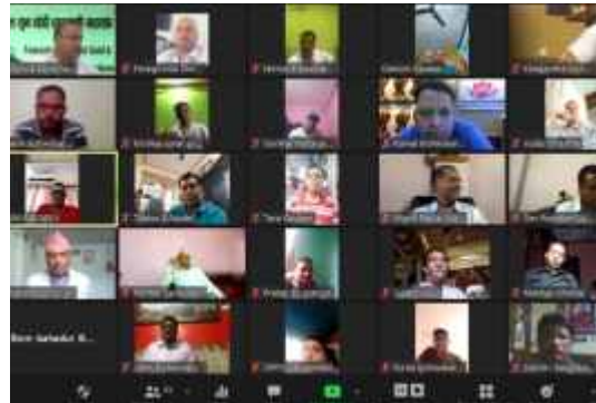
भर्चुअल बैठकमा सहभागिता जनाउँदै नेपाल सुनचाँदी व्यवसायी महासंघका पदाधिकारी तथा सदस्यहरु ।