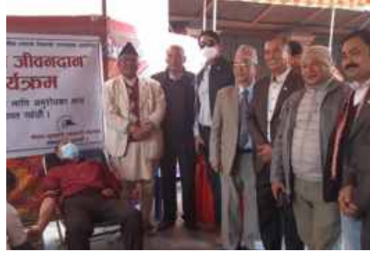
नेपाल सुनचाँदी व्यवसायी महासंघको नवौँ स्थापना दिवसमा अवसरमा आयोजित रक्तदान कार्यक्रमको ऋलक ।