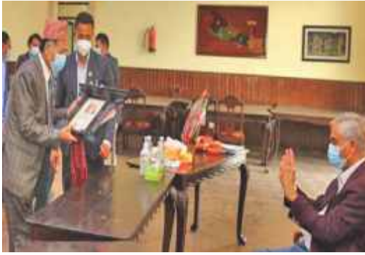
प्रधानमन्त्री शेर बहादुर देउवासँग भेटगर्दै नेपाल सुनचाँदी व्यवसायी महासंघको प्रतिनिधि मण्डल ।