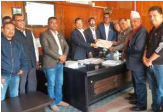
वाणिज्य आपूर्ति तथा उपभोक्ता संरक्षण विभागका महानिर्देशकसँगको भेटका व्यवसायीहरु ।