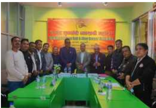
नेपाल सुनचाँदी व्यवसायी महासंघको पदाधिकारी बैठकमा सहभागी व्यक्तित्वहरु ।