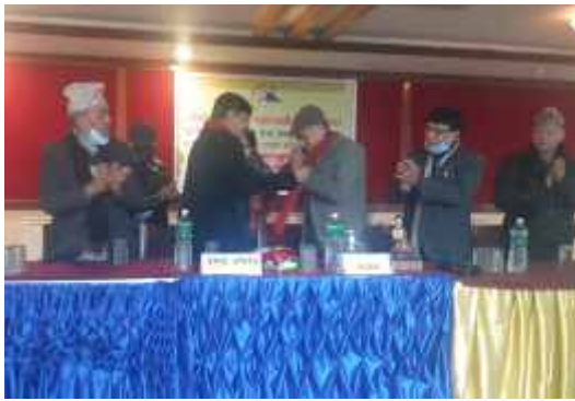
नेपाल सुनचाँदी रत्न तथा आभुषण महासंघ र नेपाल सुनचाँदी व्यवसायी महासंघका पदाधिकारीहरु ।